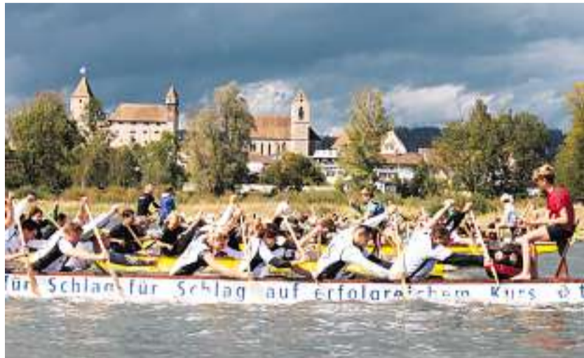
Spass und Bewegung: Das Drachenbootrennen in Rapperswil-Jona ist seit 20 Jahren ein Spektakel.

Übermorgen Samstag und am Sonntag, jeweils ab 9 Uhr, findet beim Lido in Rapperswil-Jona das 20. Drachenbootrennen statt. Das ist Grund genug, den gesamten Anlass in eine grosse Party zu verwandeln.