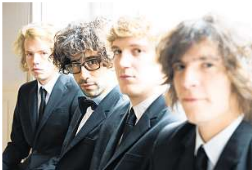
Mit Pegasus steht eine äusserst erfolgreiche Schweizer Band auf der Openair-Bühne in Pfäffikon.